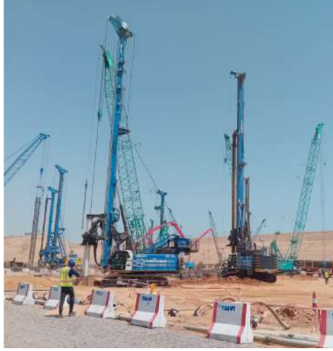
NEOM "The Line" project - Arabia Saudita

Bottom plug impermeabili orizzontali possono essere installati utilizzando tecniche di miglioramento del suolo, come il grouting, il jet grouting o il soil mixing.