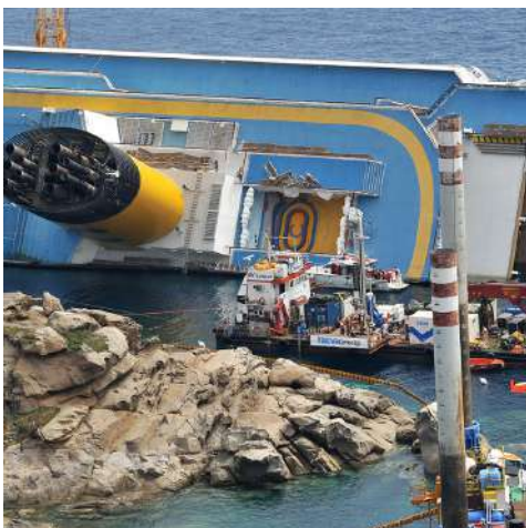
Recupero relitto "Costa Concordia" - Italia