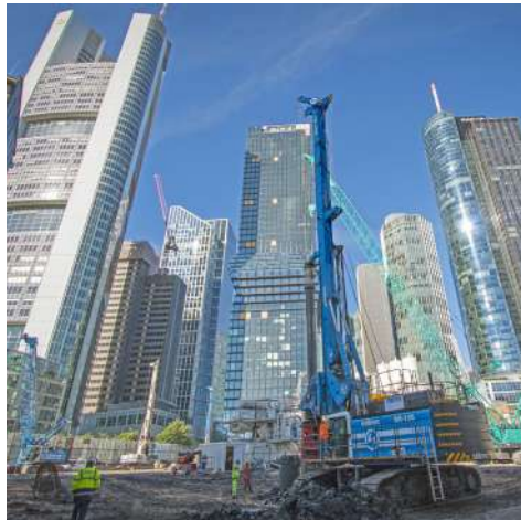
Fondazioni progetto Frankfurt Four - Germania