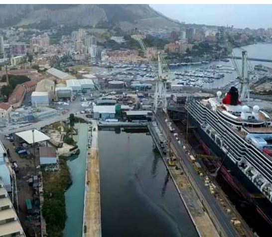
Recupero ambientale, Bacino carenaggio, Palermo - Italia

Grazie alla sua sessantennale esperienza sul campo, Trevi è riuscita a sviluppare, testare e offrire un'ampissima gamma di tecniche di miglioramento del suolo.