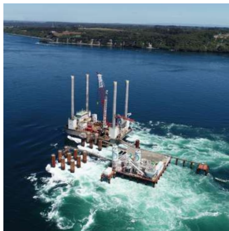
Fondazioni Ponte di Chacao - Cile