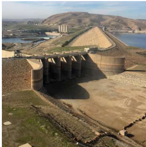
Messa in sicurezza diga di Mosul - Iraq