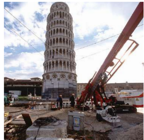
Messa in sicurezza Torre di Pisa - Italia