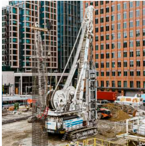
South Station, Boston MA - USA